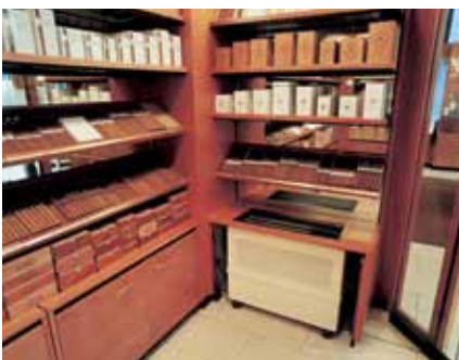
Optimale Bedingungen für die Aufbewahrung edler Cigarren