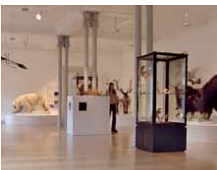
Wertvolle Kulturgüter schützen und erhalten