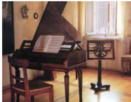
Wohlklang teurer Instrumente erhalten