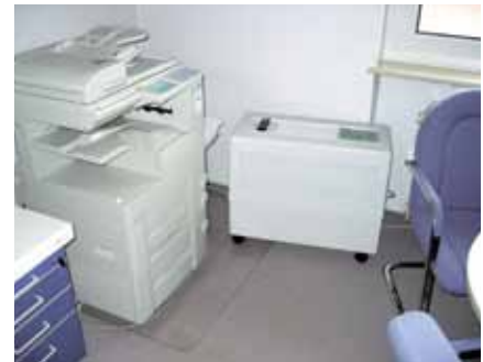
Technische Einrichtungen vor Betriebsstörungen sichern