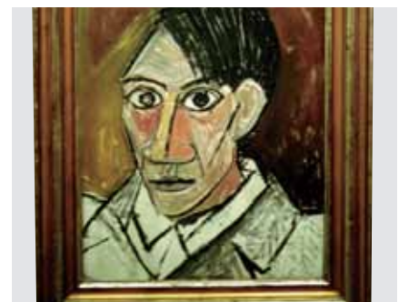
Bilder und Rahmen für die Nachwelt in Form halten