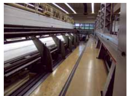
Betriebsunterbrüche, Stillstandzeiten und Qualitätsmängel vermeiden