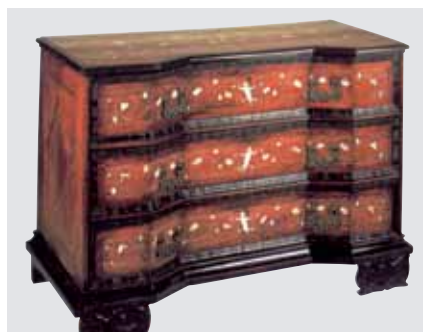
Wertverlust einmaliger Antiquitäten vermeiden