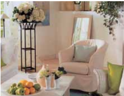
Gesundheit und Wohlbefinden im Büro und Zuhause