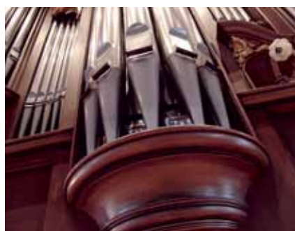
Vermeidung von unreparierbaren Schäden an Kirchenorgeln